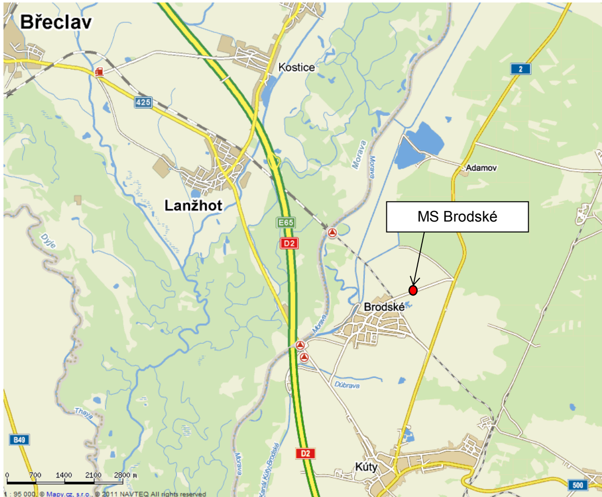
Obr. č. 2: Lokalizace MS Brodské

Vstupní/výstupní bod pro Zásobník – MS Brodské. Lokalizace MS Brodské je znázorněna na obr. č. 2.